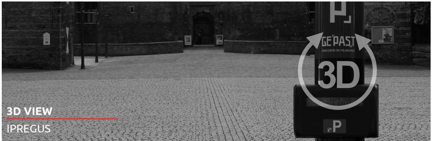
3D VIEW IPREGUS