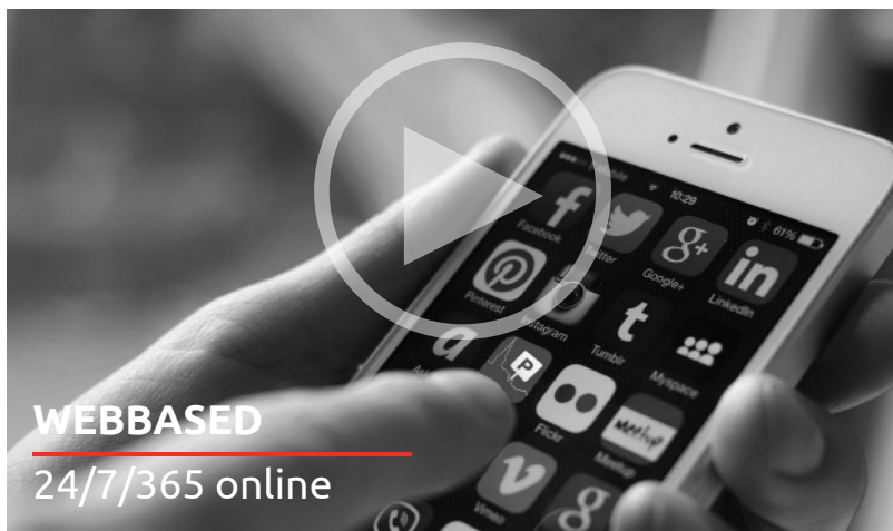
WEBBASED 24/7/365 online