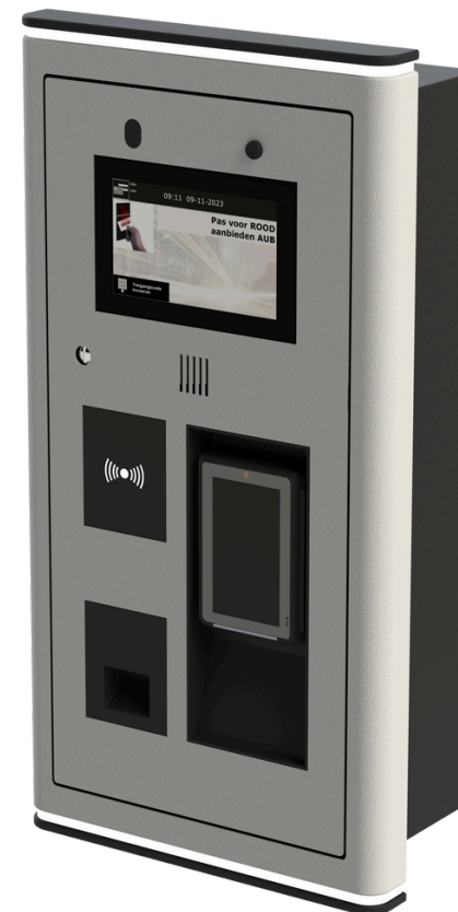
Semi flush | Wall mount